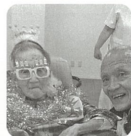
白寿のお祝いの会にて