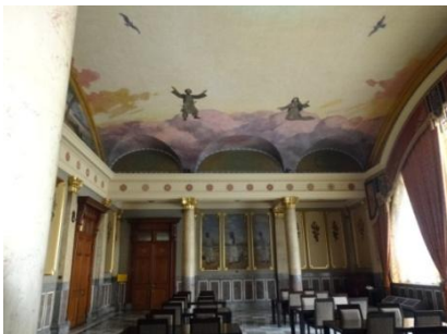
壁画が美しい特別室