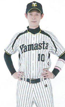
山田スタジアムさん

参加希望の方は、同封の返信ハガキに必要事項を記入し、締め切りまでにご投函ください。