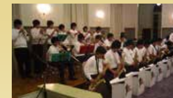
甲南中高プラスアンサンブル部