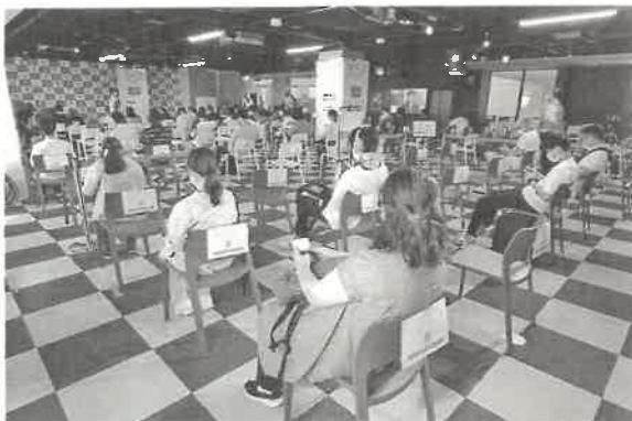
<ワクチン接種の様子>

という3つのスローガンを掲げ、新たな世紀“甲南新世紀”での活動を懸命に進めています。東海甲南会の皆様方におかれましても、引き続き、甲南学園にご支援、ご鞭撻をいただきますようお願い申し上げます。東海甲南会のますますのご発展、会員の皆様のご健勝を心より祈念しております。今後ともよろしくお願いいたします。