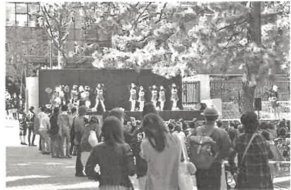
<2021年度摂津祭の様子>